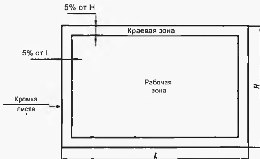
Рисунок 2 – Осматриваемые зоны стекла с покрытием конечного размера